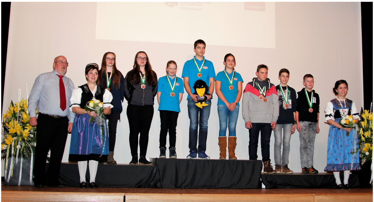
Verschiedene Wettkampfsponsoren nehmen die Gelegenheit wahr, die begehrten Medaillen zu übergeben.